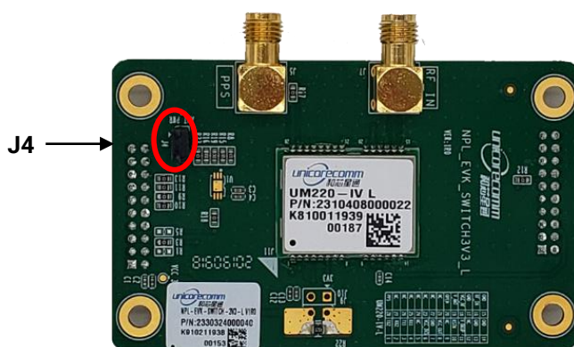
图 5-1 3V3-L 板 J4 指示

步骤3：在 NPL_EVK_SWITCH3V3_L 板上 J4 (ANT_PWR) 安装跳线帽，对天线提供 3V 供电。