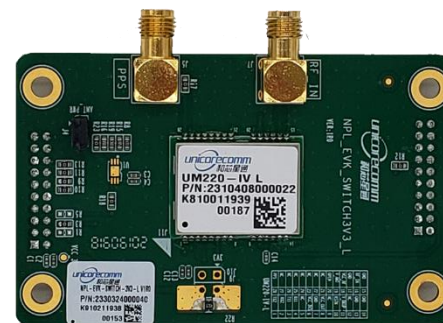
图 2-3 3V3-L 板正面图